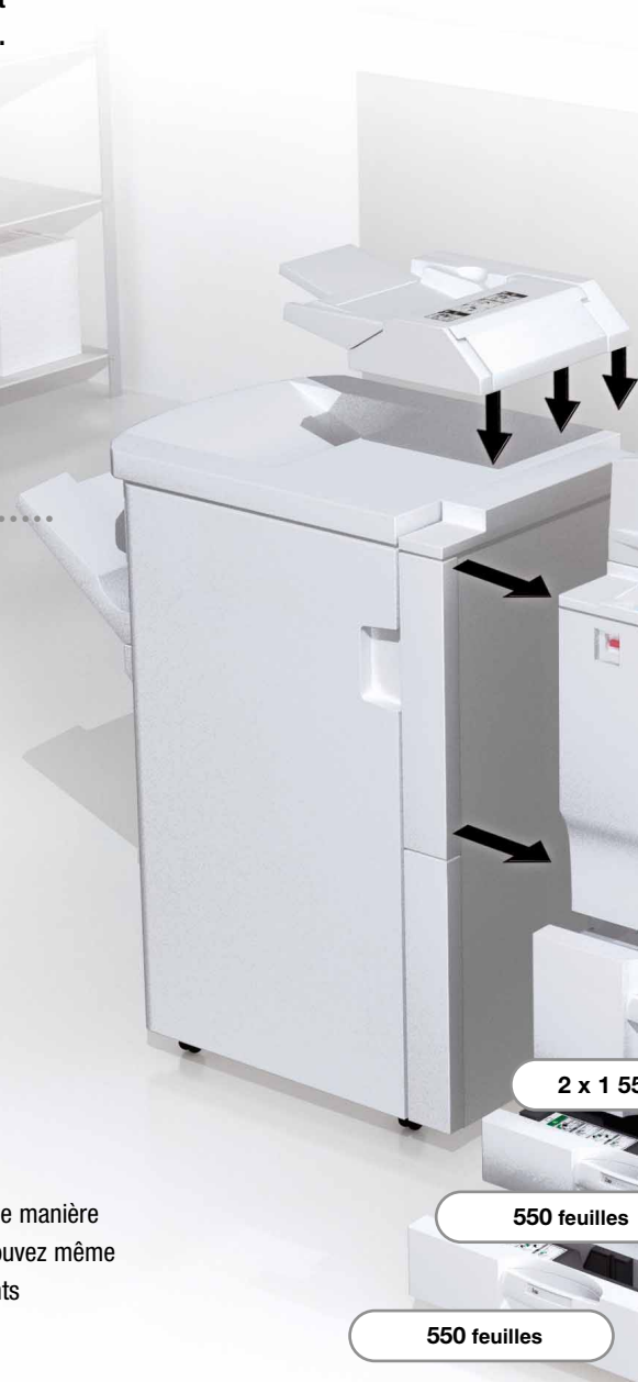
Inserteur de couvertures

Numérisez des documents afin de les stocker et de les réutiliser de manière intelligente pour une impression sur demande très rapide. Vous pouvez même utiliser la fonction Scan to e-mail si vous voulez fournir à vos clients des épreuves au format numérique.